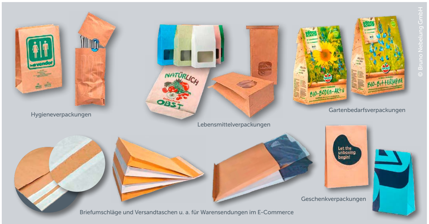
Beispiele für branchenübliche Verpackungen